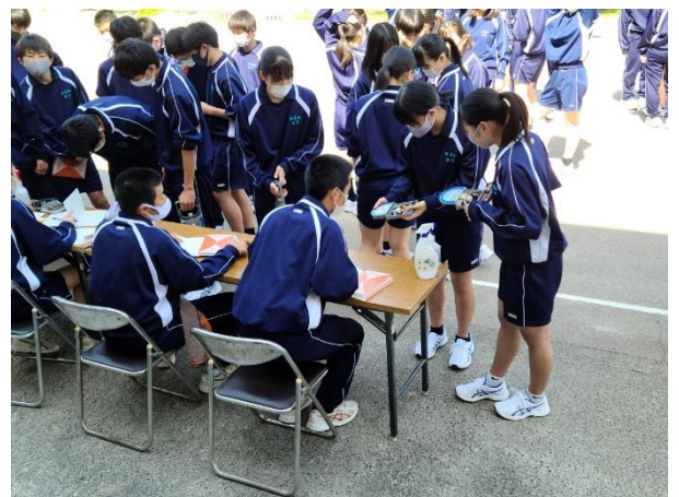
補助役員さんありがとう