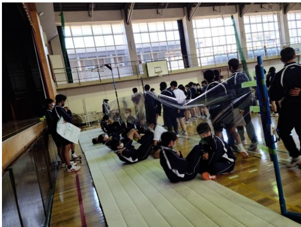
感染症対策ばっちりですて起きこし

絶好のスポーツ日和となった本日、全学年でスポーツテストと身体測定が実施されました。新型コロナウイルス感染症対策を万全にし、お互い注意しながらも、昨年は実施できなかった行事を一つ体験できました。生徒たちは、一生懸命、そして楽しそうに、スポーツテストの各種目、身体測定の計測に取り組みました。保健委員、体育委員、部活動部員による補助役員の任務も立派に果たしてくれました。