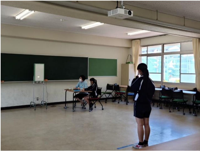
校舎内での計測もスムーズにいきました