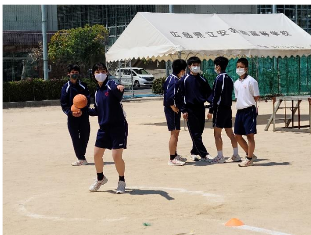
ハンドボール投げには手前から声援が！