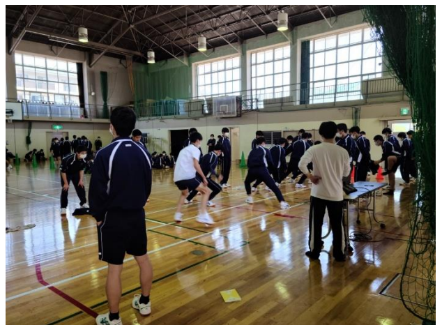
反復横跳び何回行けるかな