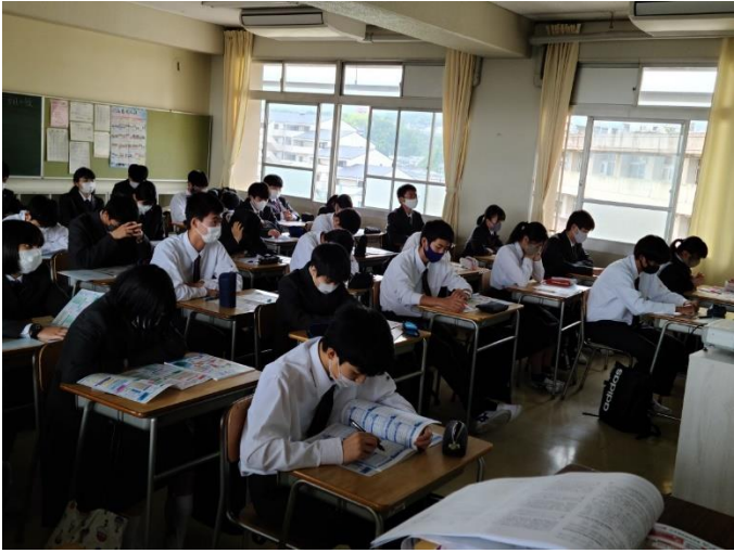
必死に指示された箇所を確認