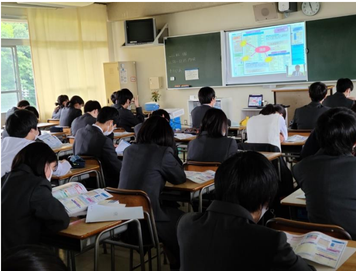
自分の適性を確認しながら視聴

1 学年で、Zoom を利用した進路講演会を実施しました。4 月当初に受検した進路適性検査の結果をもとに、どのように自分の進路決定に活かすかについて、福岡心理センターの丸山先生に話していただきました。本来なら福岡から本校に訪問、直接生徒に話をしていただく形で計画をたてていましたが、Zoom での開催に切り替え、各HRでの実施としました。生徒は、スクリーンを見ながら、手元にある自身の適性検査結果と照らし合わせて、自分の進路適性（職業分野や学問分野）について確認しました。途中音声トラブルがありましたが、中身の濃い進路LHRとなりました。