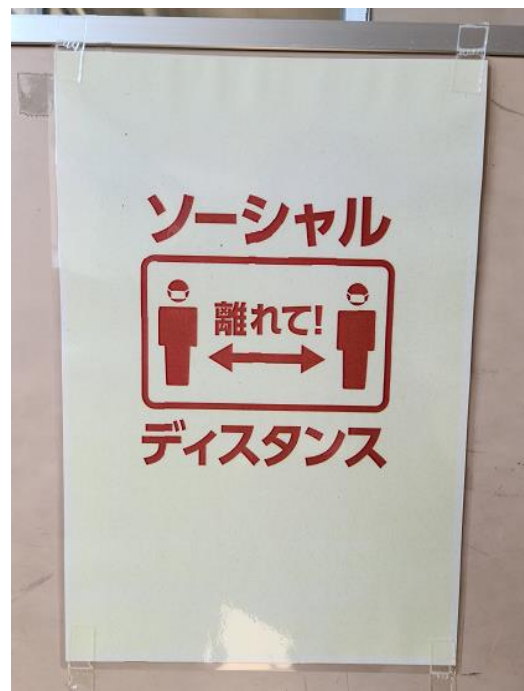
みんな意識を高くもって行動しましょう!