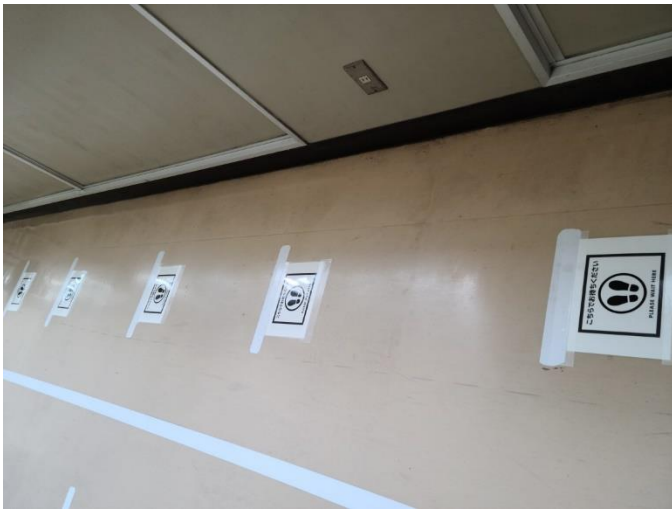
売店前の廊下にも目印