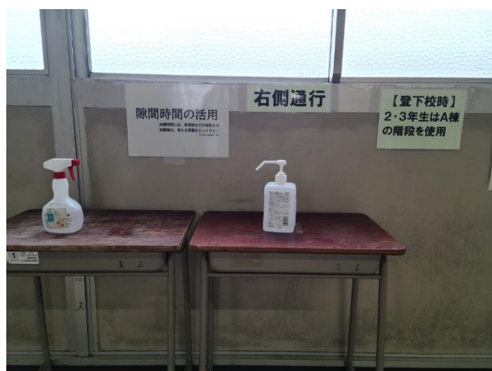
使用階段も学年で分けています