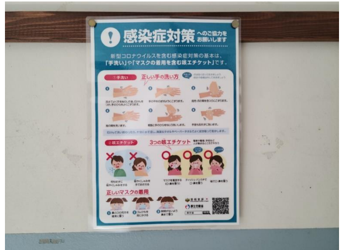
校内あらゆる場所で注意喚起