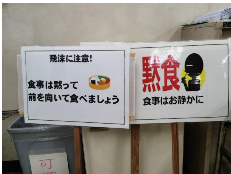
昼食会場を分散、黙食を呼びかける立て看板